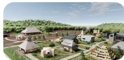
▲Awaji Nature Lab & Resort